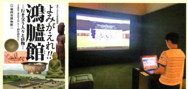
福岡市博物館特別展チラシと展示されたシステム