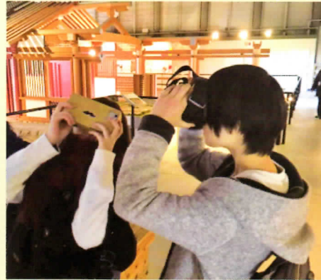
鴻臚館スマートフォンアプリを体験

本事業の成果物は、当教材開発センターのホームページにて公開しております。福岡の歴史に興味のある方々の学習資源として、また福岡市の観光集客に役立つことを期待しております。