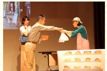
昨年度の寸劇の一場面